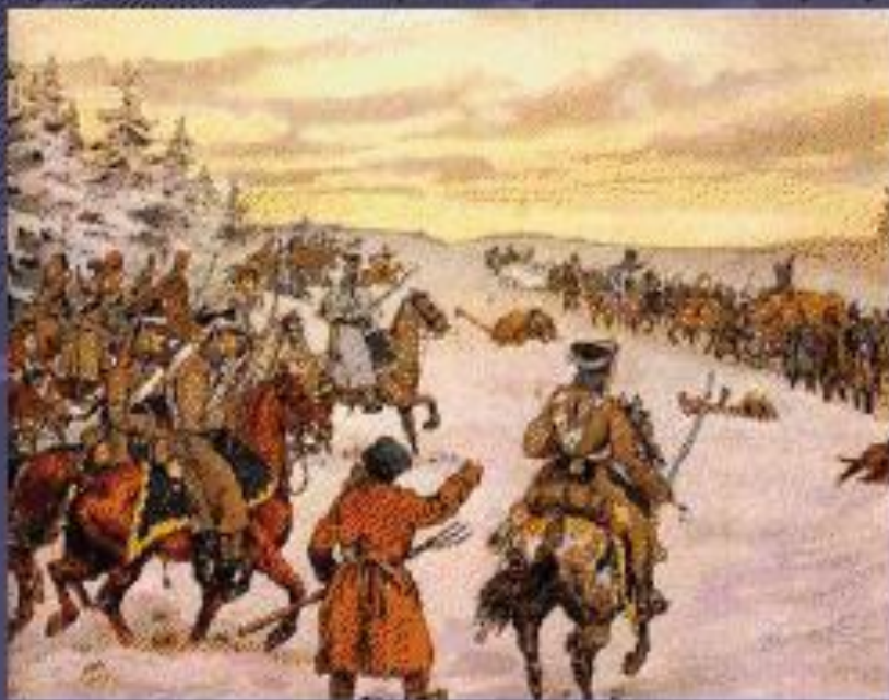
Нападение партизан отряда И. С. Дорохова на французский обоз в районе Перхушкова. Хромолитография