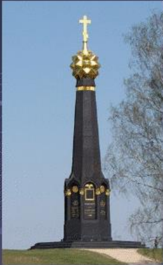
Главный монумент русским воинам, героям Бородинского сражения.

У подножия монумента были захоронены останки князя Петра Ивановича Багратиона, перенесенные сюда по указу императора из села Сима Юрьев-Польского уезда Владимирской губернии, где в имени своих родственников князей Голицыных первоначально был погребен известный полководец, скончавшийся от ран, полученных в Бородинском сражении.