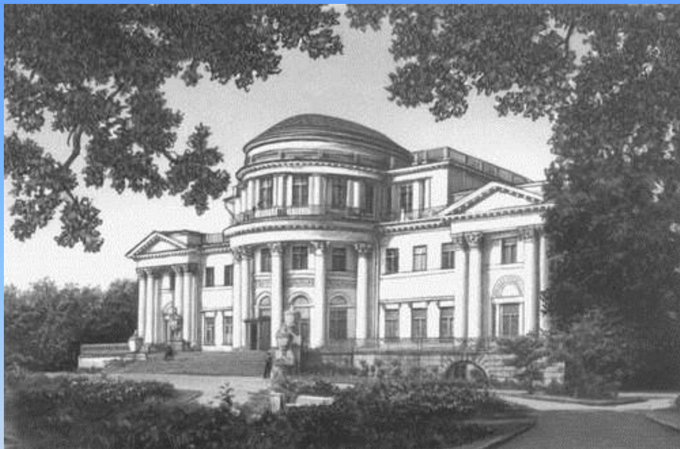
Питер. Елагин дворец.