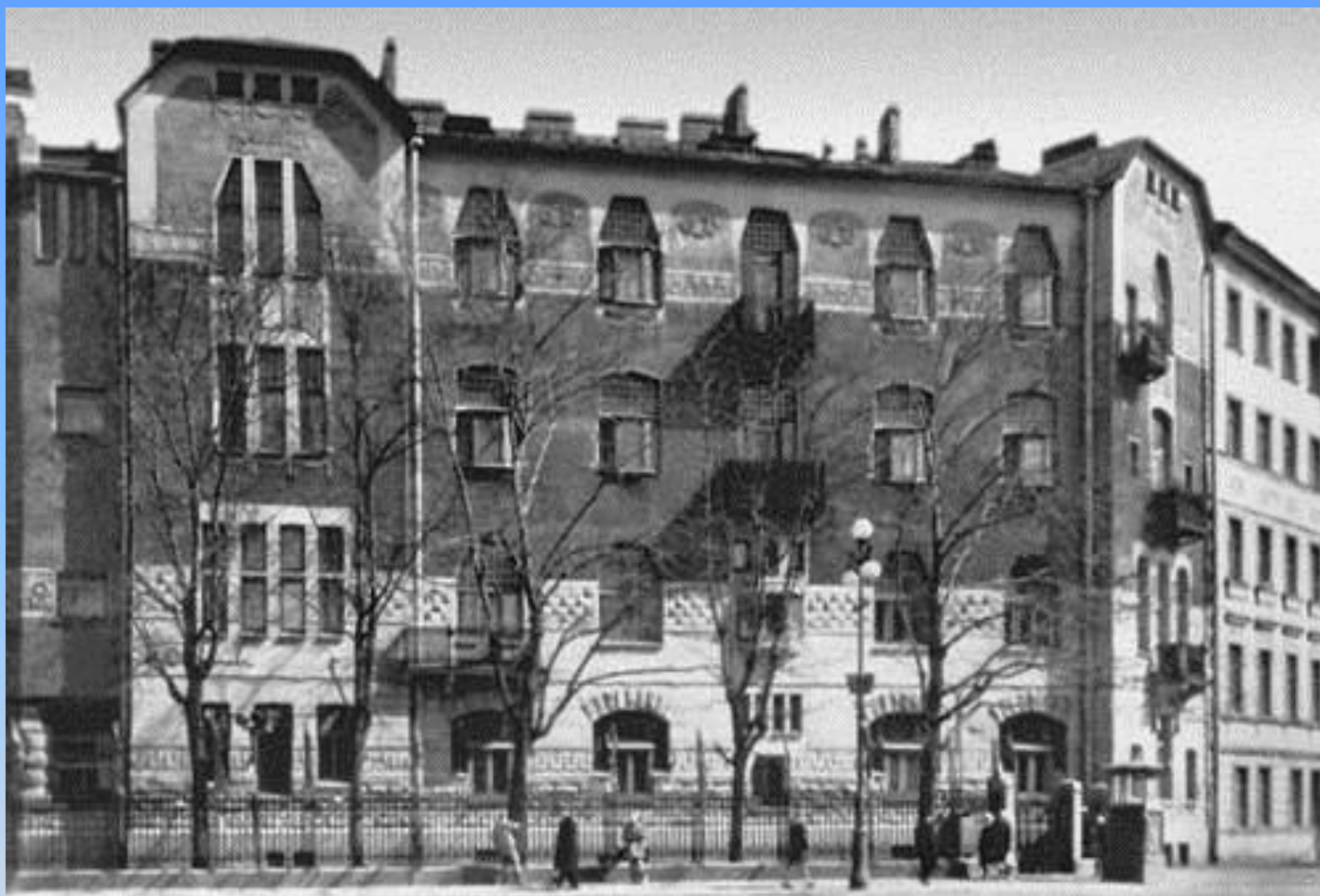
Петербург. Доходный дом.