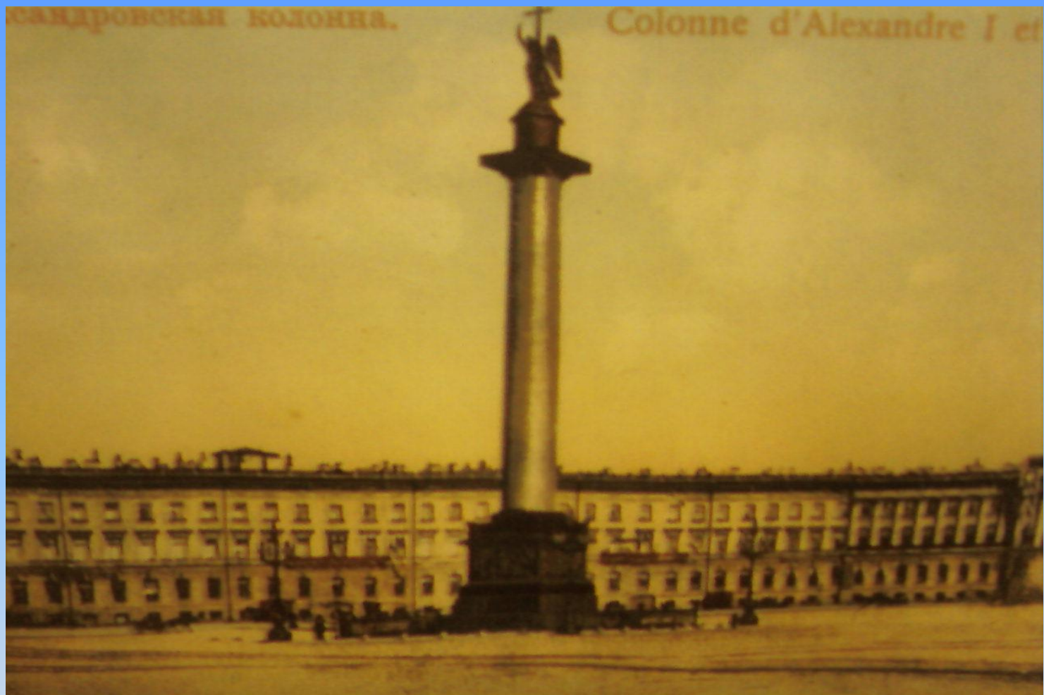
Санкт-Петербург. Александровская колонна.