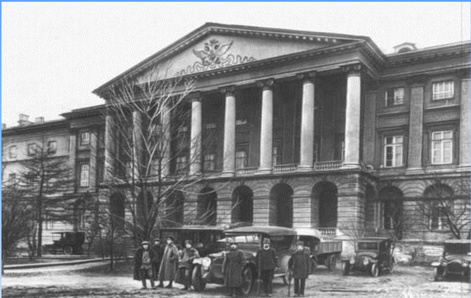
Питер. Смольный (1917).